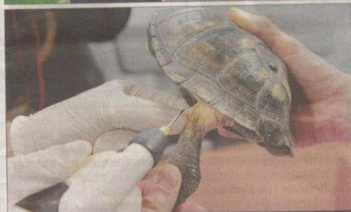
PUÇAGE. 105 tortues de l'aquarium ont été pucées hier. Une opération délicate mais obligatoire.

« On va garder tous les animaux qui sont parrainés par des particuliers »